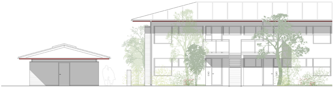
Hedemarksvænget, gavltrappe nedrives og der etableres nyt stort vindue i køkkener.